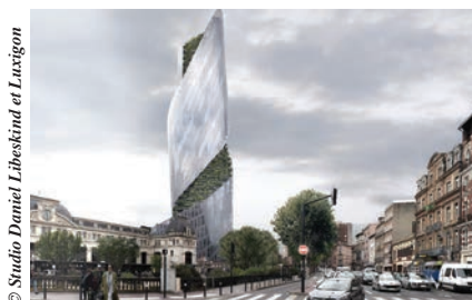
© Studio Daniel Libeskind et Luxigon

C SD & Associés mobilise son expertise pour la construction de la Tour Occitanie à Toulouse (31). Une mission qui lui a été confiée par la Compagnie de Phalsbourg, pilote d'un groupement dont les architectes sont Daniel Libeskind (mandataire) et Kardham Cardete-Huet (associés). Cette opération s'inscrit dans le cadre du nouveau quartier de la gare de Toulouse Matabiau réaménagée en pôle multimodal. La structure à la fois impressionnante, audacieuse et vertueuse sur le plan environnemental, devrait être livrée en 2022. Elle s'élèvera à 150 m au-dessus du sol.